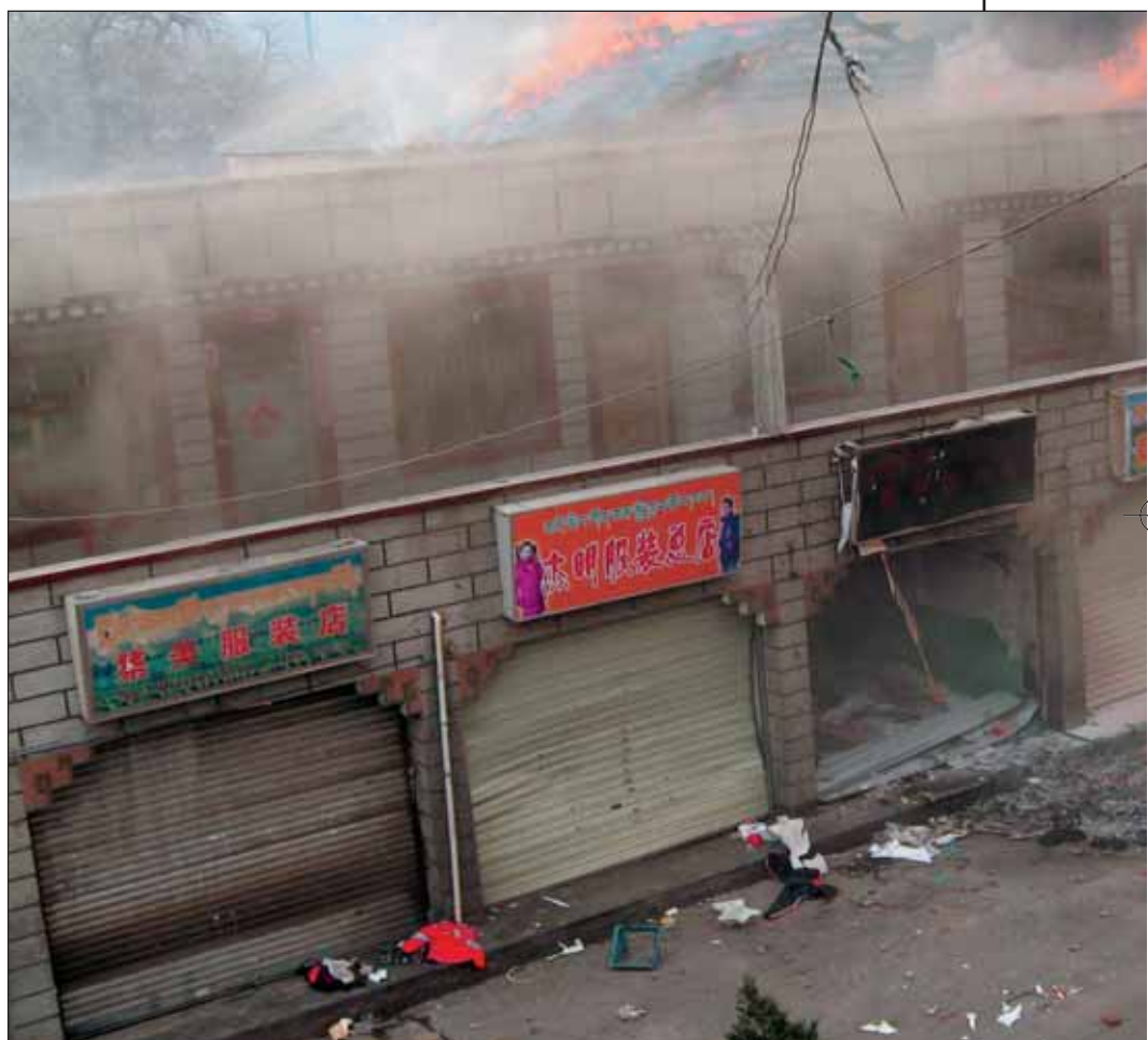
En mars dernier, magasins et restaurants chinois ont été mis à feu par des tibétains en furie à Lhasa.

Relevons une contrevérité flagrante. Patrick French est un ancien directeur de la Free Tibet Campaign (Campagne pour un Tibet libre), basée à Londres, un des fers de lance d'une « cause tibétaine », vue des pays occidentaux. Pourtant, French écrit, dans le New York Times (3) que le chiffre du million (le chiffre précis avancé est de 1,2 million) de Tibétains tués par les Chinois depuis 1950 ne tient pas. Lors des recherches pour son livre Tibet, Tibet (4) , dit-il, « je n'ai trouvé aucune preuve pour soutenir ce chiffre ». French écrit encore : « L'internationalisation de la question tibétaine n'a eu aucun effet positif sur Beijing [...] La direction (chinoise) ne peut