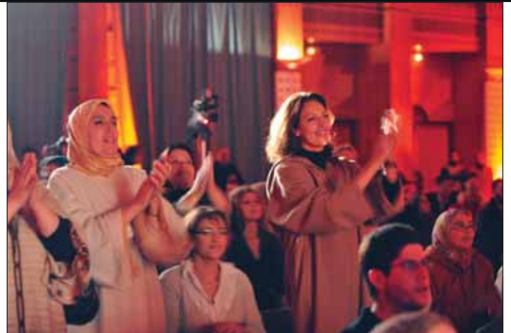
Grand succès pour les artistes invités.

fondatrices du soufisme, comme Raia Adawiya ou Amina Ramniyya. Si Dieu est vécu dans la conscience islamique comme étant masculin, toutes les sourates, sauf une, commencent par la basmala (« au nom de Dieu le Tout Miséricordieux »), qui expriment la Rahma (« la miséricorde divine »), nom arabe féminin dérivé de la racine Rahm signifiant matrice. Le Prophète, passant devant une femme qui allaitait son enfant, dit à ses compagnons : « Dieu sera plus miséricordieux avec ses hommes que cette femme avec son enfant. » Il dit aussi : « Il m'a été donné d'aimer de votre bas monde trois éléments : les femmes, le parfum, et ma consolation suprême a été placée dans la prière. » Il aimait les femmes en tant qu'êtres de chair mais aussi le