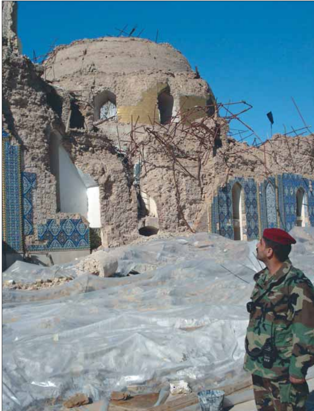
Restes du dôme doré du mausolée de l'imam al'Askari à Samarra, plastiqué en février 2006.

Zarqaoui était omniprésent, bien que personne ne l'eût vu nulle part. Omar al-Baghdadi, lui, est carrément invisible. Selon des témoignages, il n'existe pas. L'homme au visage caché des vidéos serait un acteur utilisé pour la circonstance. Il « gouverne » néanmoins son émirat virtuel entouré de ministres. Celui de la